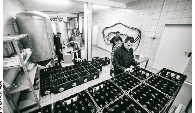
Przygotowanie zamówionych piw. Etykietowanie, liczenie, pakowanie do kartonów, skrzynek, tworzenie palet – jest się czym zająć

- Produujemy sześć gatunków piwa. Niektóre będziemy wytwarzać rzadziej na rzecz nowych. Ludzie oczekują nowości. W świecie piwnym, dość zamkniętym, musimy na okrągło zmieniać receptury, tworzyć nowe piwa. Szukamy też partnerów w innych krajach, aby stworzyć kolejne kooperacyjne piwo. Przyjaciele ze świata piwnego radzili nam, żeby na lato zrobić piwo pszeniczne, czyli typowo niemieckie. Jesteśmy browarem craftowym, który robi piwa z użyciem chmieli amerykańskich, aromatyczne. Wizyta w Bawarii otworzyła nam oczy, jak może smakować piwo pszeniczne. Uwarzyliśmy takie piwo, które roz-