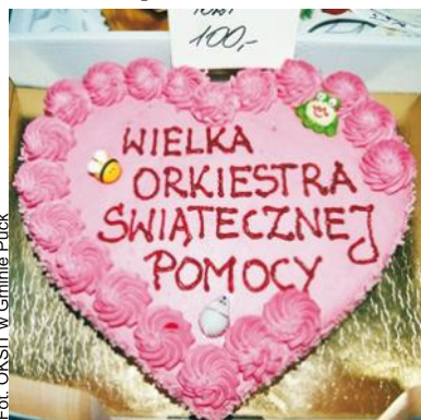
W styczniową niedzielę na ulicach, placach, wszędzie dominował kształt serca. Można było nawet kupić słodkie serce