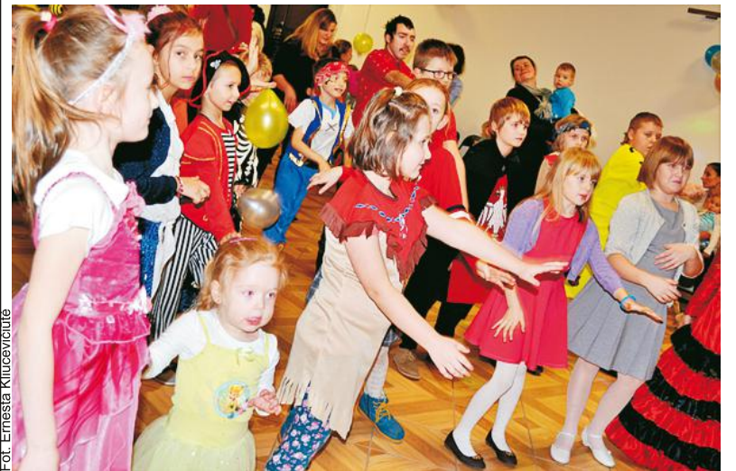
Na balu karnawałowym nie mogło zabraknąć tańców