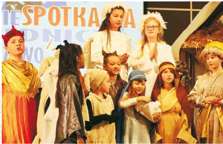
Kostiumy i scenografia były starannie przygotowane i pomagały zrozumieć widowisko

Poziom prezentacji poszczególnych zespołów świadczył o wysokim zaangażowaniu opiekunów. Organizatorem spotkania był Ośrodek Kultury, Sportu i Turystyki w Gminie Puck przy wsparciu finansowym Starostwa Powiatowego w Pucku.