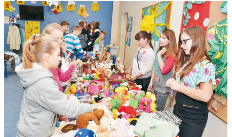
Przygotowano salę zabaw dla najmłodszych