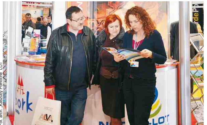
Pomorzanie prezentowało m.in. Kaszuby Północne w Warszawie w 2013 r.