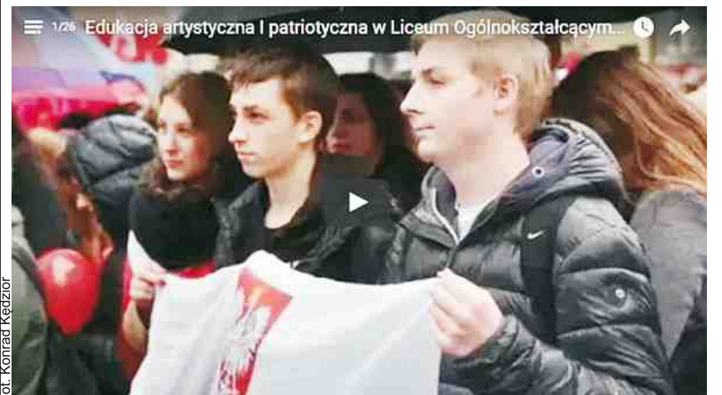
Filmy można obejrzeć na stronach www.powiat.puck.pl oraz profilach fb i youtube powiatu