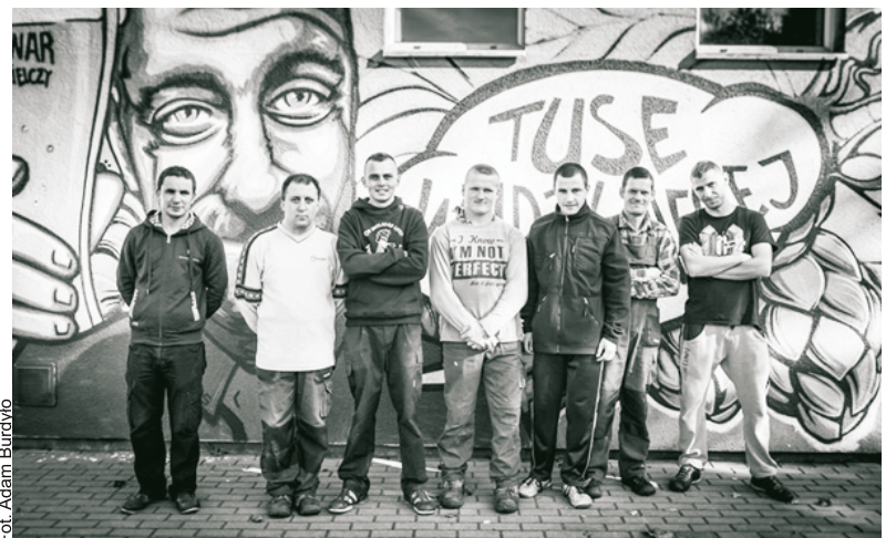
Początkowo pracownicy spółdzielni wykonywali proste prace komunalne, teraz są to głównie prace związane z warzeniem piwa

Spółdzielnie założyły osoby prawne: Puckie Stowarzyszenie Osób Wspierających Osoby Niepełnosprawne „Razem”, Miasto Puck i Gmina Krokowa.