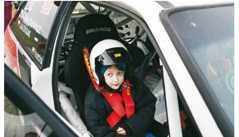
Dla fanów motoryzacji nie lada gratką były przejażdżki samochodami rajdowymi