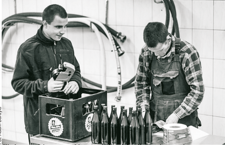
Kiedy zawodzi sprzęt etykietowanie butelek odbywa się ręcznie

25 tys. zł. Wygrał nasz projekt na wspólne warzenie piwa kooperacyjnego z browarem angielskim. Kiedy przygotowaliśmy się do warzenia piwa z Anglikami szukaliśmy browaru, który działa podobnie jak my. Początkowo prowadzący angielski browar w miejscowości Heskett Newmarket postanowił browar sprzedać, zamknąć. Wówczas mieszkańcy go wykupili. Zaczął on działać na nowych zasadach. To społeczność lokalna powoływała pracowników, zarząd browaru. Sam książę Karol odwiedził browar, ponieważ uznał inicjatywę za cenną. Zyski z browaru polepszają życie mieszkańców. Zależało nam na takim partnerze. Nazwę naszego piwa „Dwa półszytki”, po angielsku double hitch, wymyślili Anglicy, ponieważ zależało im, aby w nazwie było słowo „dwa”. Wiedzieli, że naszą linię piw nazwiemy węzłami żeglarskimi. W sezonie letnim nasze