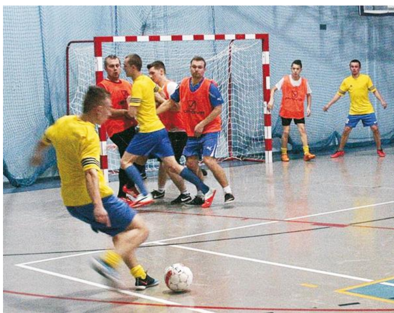
Rozgrywki kosakowskiej halówki osiągnęły półmetek