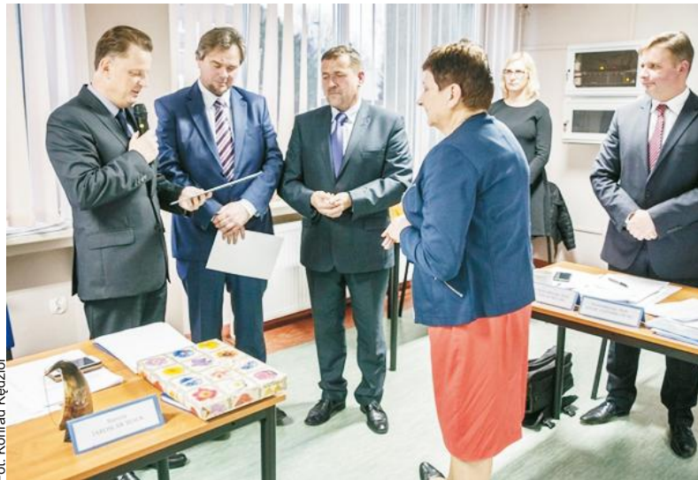
W pożegnaniu skarbnika wzięli udział wszyscy radni, pracownicy starostwa oraz dotychczasowi starostowie pucey