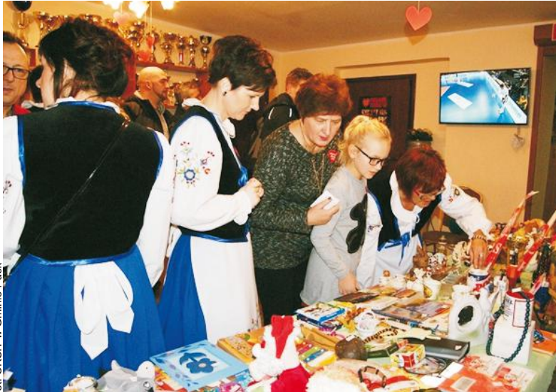
Mieszkańcy gminy Puck chętnie kupowali, aby wesprzeć szczytny cel akcji

W dziewięciu miejscowościach: Mieroszynie, Strzelnie, Gnieździe, Swarzewie, Połczynie, Werblini, Darzłubiu, Leśniewie i Połchowie odbyły się imprezy kulturalno-rozrywkowe o charakterze charytatywnym. Muzyczny ton tegorocznej orkiestry nadały m.in. zespoły Sukces w Werblini, Bolero w Darzłubiu, Colored w Leśniewie, Czarne kapelusze w Swarzewie