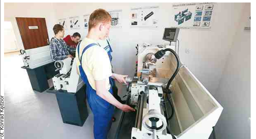
Kształcenie techników mechaników odbywa się w dobrze wyposażonych salach Powiatowego Centrum Kształcenia Zawodowego i Ustawicznego w Pucku