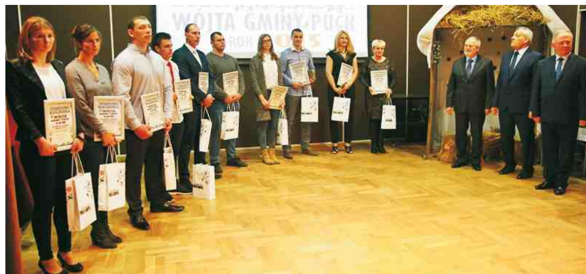
Na gali można było spotkać dziesięciu najlepszych sportowców ubiegłego roku