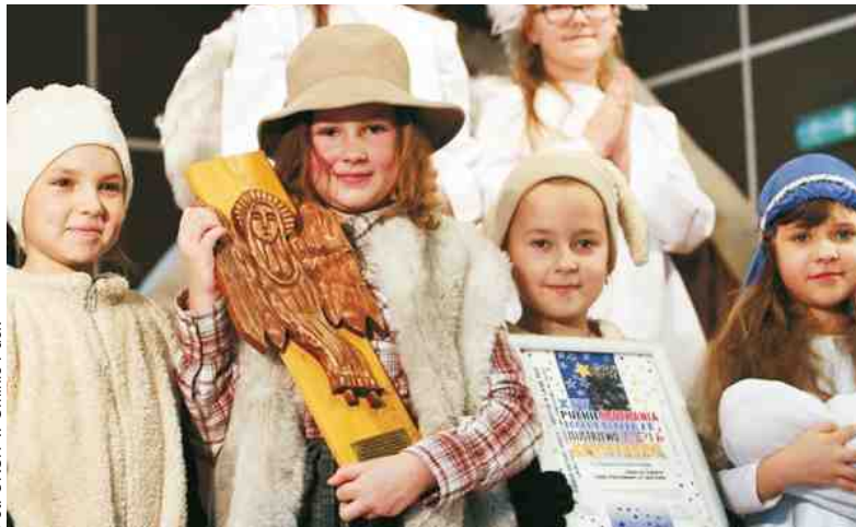
Nagrody za kreację aktorską trafiły do uczniów