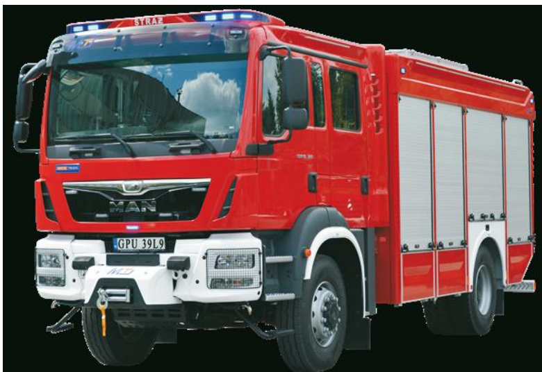
Ten pojazd strażacki będzie pomagać w ochronie życia i mienia w okolicach Żarnowca

Wóz o kryptonimie 509[G]72 trafi do pododdziału w ciągu kilku najbliższych dni i będzie to pierwszy fabrycznie nowy pojazd tej klasy w jednostce jak i całej gminie Krokowa. Samochód o napędzie terenowym