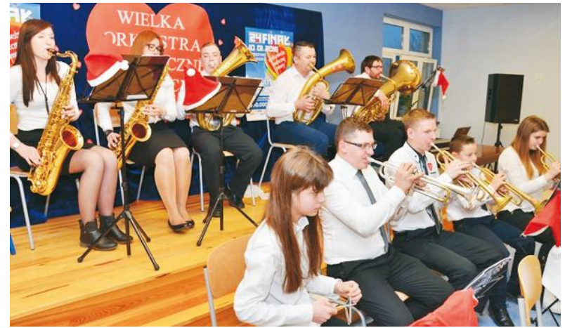
Scenę muzyczną opanowała Dęta Orkiestra Strażacka z Wierzchucina