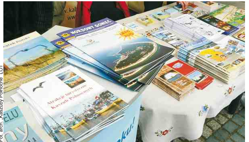
Nordowy Goniec to stały element wydawniczy ukazujący się aktualnie pod nazwą Kaszuby Północne - biuletyn