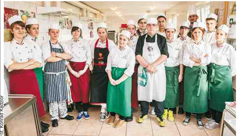
Przyszli adepci sztuki kulinarnej kształcą się w klasie gastronomicznej Zespołu Szkół Ponadgimnazjalnych w Klaninie

Powstanie w sumie dwanaście filmów dotyczących oferty edukacyjnej oraz oferty dodatkowych zajęć pozalekcyjnych z trzech placówek: Powiatowego Centrum Kształcenia Zawodowego i Ustawicznego w Pucku, I Liceum Ogólnokształcącego w Pucku oraz Zespołu Szkół Ponadgimnazjalnych w Klaninie.