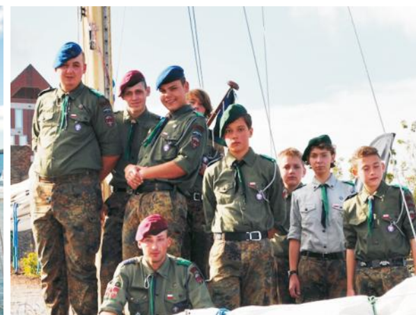
Harcerze w strojach służbowych na pokładzie