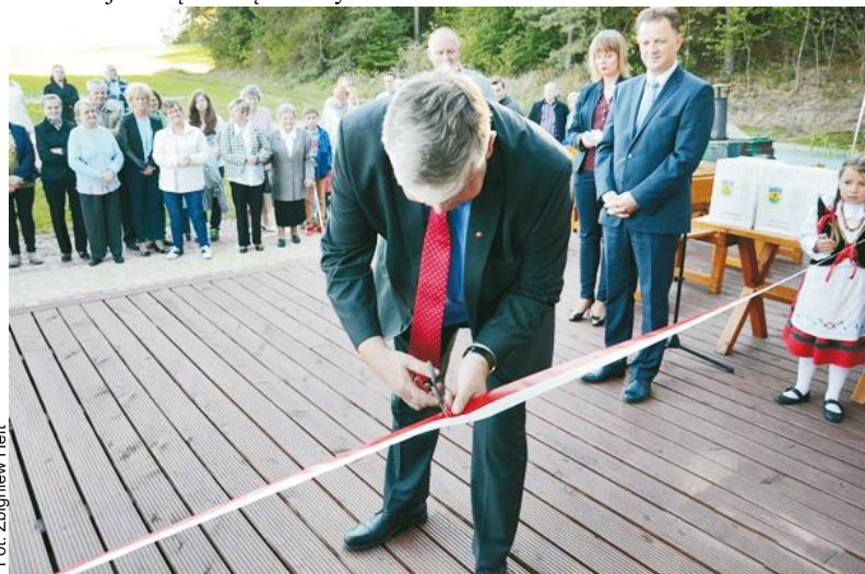
Przecięcie wstęgi symbolicznie otwiera obiekt do użytkowania przez lokalną społeczność