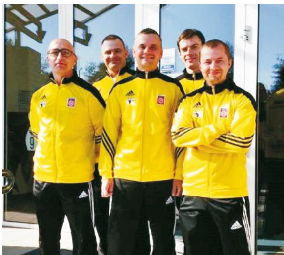
Drużyna OKSiT Gmina Puck zaprasza na turniej do puckiej kręgielni w dniu 7 listopada 2015. Wstęp wolny.