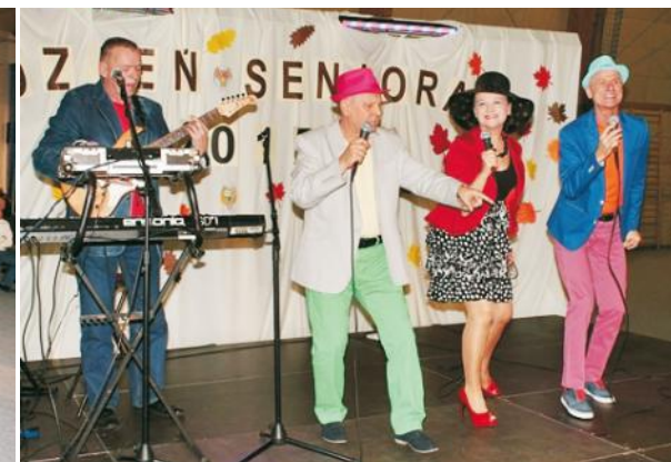
Rozrywek było co nie miara podczas pamiętnego wieczoru seniorów

- Biblioteka Publiczna Gminy Kosakowo im. Augustyna Necla informowała o ofercie czytelnicy oraz wydarzeniach organizowanych przez bibliotekę; - stoisko firmy kosmetycznej, na którym przeprowadzano zabiegi na dłonie, pokaz makijażu oraz pro-