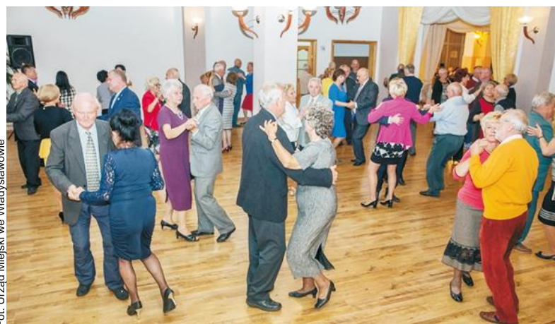
Seniorzy lubią się dobrze bawić, zwłaszcza w tańcu