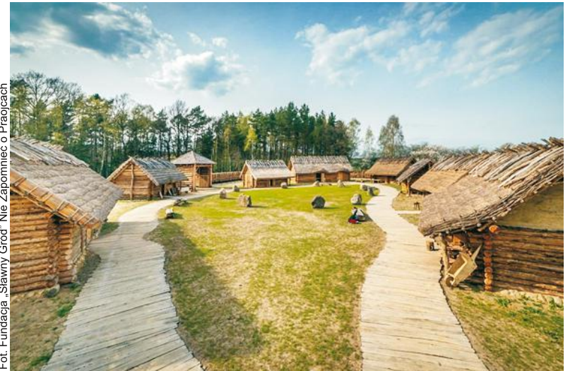
Fot. Fundacja „Sławny Gród” Nie Zapomnieć o Praojcach