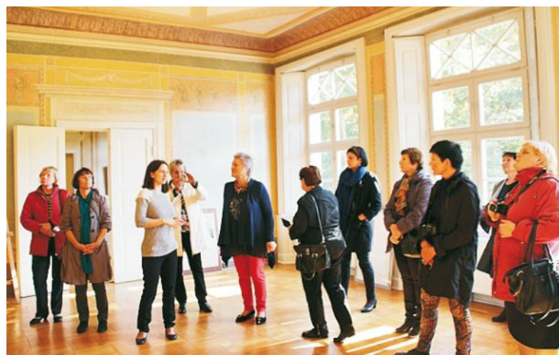
Łotysze zapoznali się ze zbiorami muzeum oraz historią powstania obiektu pałacowego