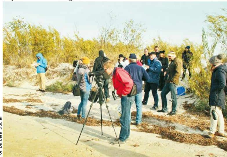
Obserwując przez lornetę widać jak ptak wygląda, jaki ma kolor i kształt

Wejherowo - Rekowo Górne. Szlak dworów i pałaców