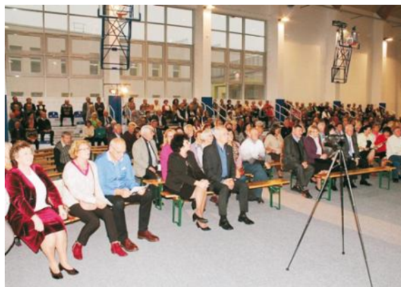
Na zaproszenie odpowiedziało ponad 500. seniorów z gminy Kosakowo