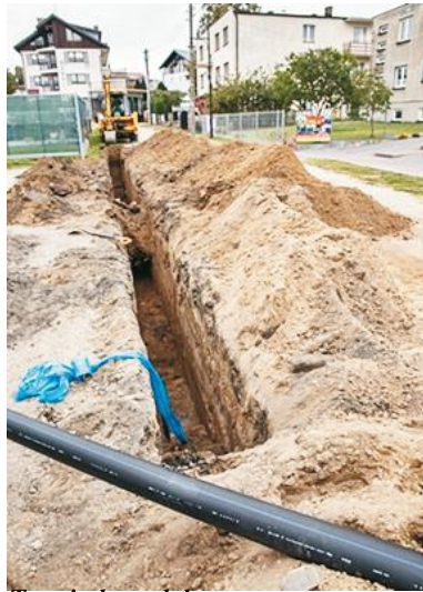
Trwają kompleksowe prace remontowe na ul. Lipowej w Jastrzębiej Górze

Inwestycja finansowana jest ze środków Gminy Władysławowo oraz spółki EKOWIK.