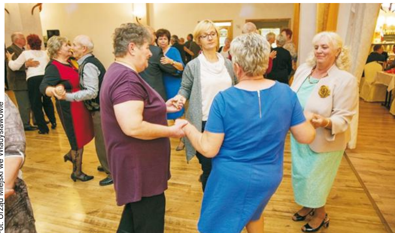
Ruch skoordynowany z muzyką odbywał się solo, w parach lub w kółku