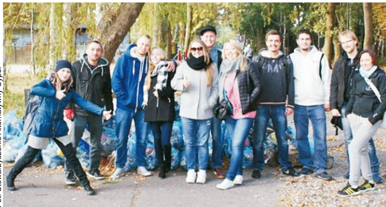
Zadowolone miny mówią: Akcja udana, jest czystiej i przyjemniej w Helu