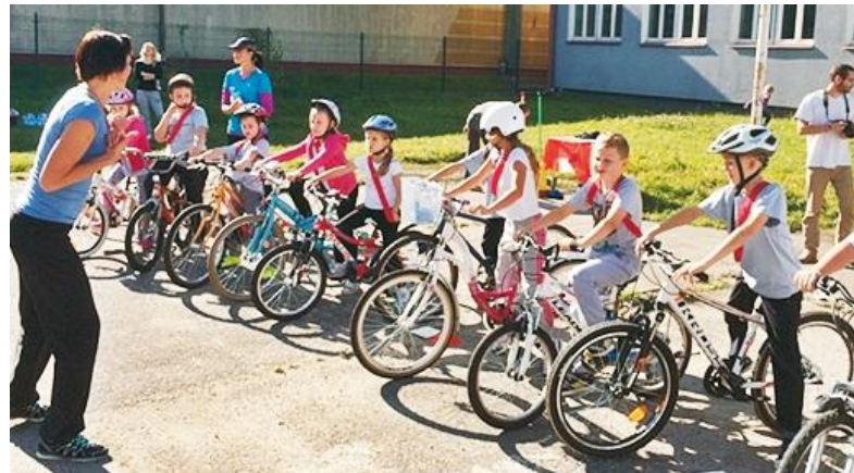
Zasady rywalizacji na rowerach tłumaczy jedna z organizatorek