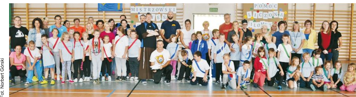
Zbiorowe zdjęcie uczestników Dnia Rodziny