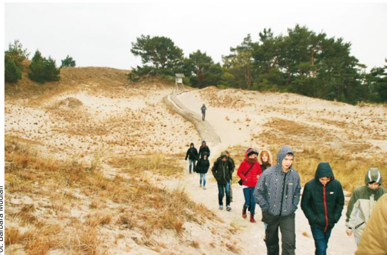
Specjalnie wyznaczona ścieżka przyrodnicza w rezerwacie „Helskie wydmy” wiedzie do samego morza