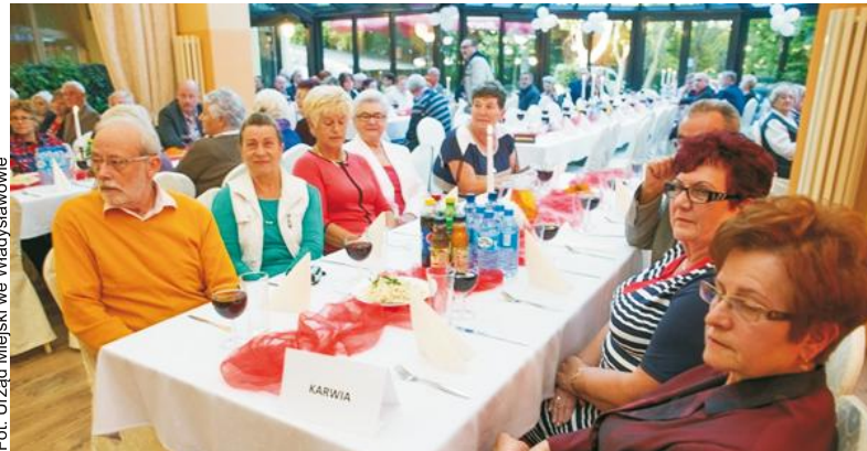
Wspólne biesiadowanie jest okazją do rozmów i ciekawych spotkań