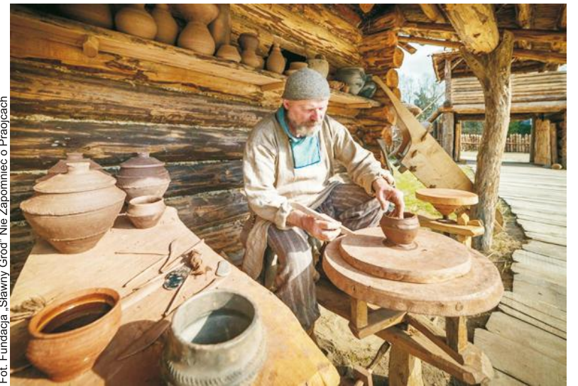
Fot. Fundacja „Sławny Gród” Nie Zapomnieć o Praojcach

Osada to kompleks ośmiu chat, każda z nich jest inna