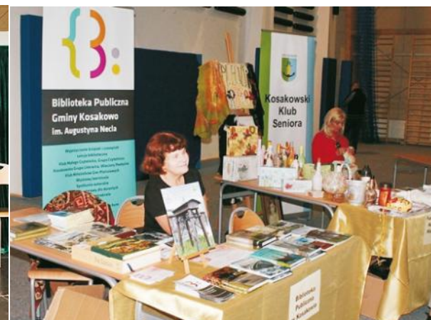
Wystawcy służyli radą i pomocą w zakresie zdrowia, porad prawnych, wyglądu i spędzania czasu