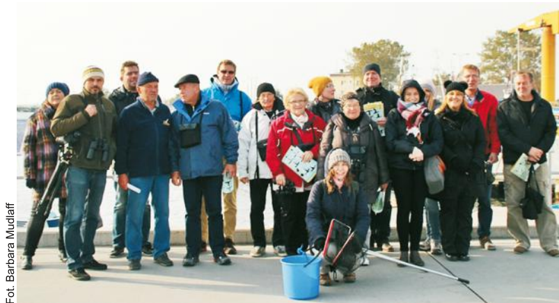
Wśród uczestników byli mieszkańcy Jastarni i osoby z branży turystycznej

było przekonać się o bogactwie flory i fauny tego akwenu. Znalezione krewetki oraz fitoplankton. Następnie podczas prezentacji multimedialnej uczestnicy przekonali się jakie inne zwierzęta i rośliny zamieszkują zatokę. Przyjrzeni się im z bliska, bo pod mikroskopem. Mieszkańcami zatoki są m.in. szproty, śledzie, dorsze, lisice, belony, turboty, kraby. Jedno jest pewne - pod wodą jest kolorowo. Zatoka Pucka to wyjątkowy akwen, który stwarza rewelacyjne warunki dla rozwoju roślin i zwierząt.