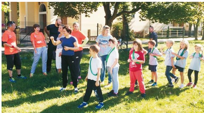
Były też kategorie, gdzie rywalizowały między sobą całe zespoły