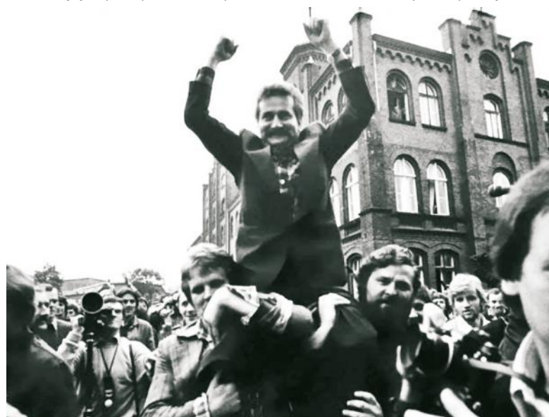
Lech Wałęsa to nazwisko kojarzymy najbardziej ze słowem „Solidarność”

mój kraj, moja Ojczyzna”. Wspiera Fundusz Stypendialny NSZZ „Solidarność” w Gdańsku (13 edycji, ponad 500 przyznanych stypendiów). Włącza się w organizację konferencji programowych, jak ta zorganizowana w Pucku na temat problemów wychowawczych w gimnazjach (a w Gdańsku także nt. sytuacji świetlic szkolnych, problemów przedszkoli i sześciolatków w szkołach, sytuacji pedagogów i psychologów szkolnych, zmian organizacyjnych i programowych w szkolnictwie ponadgimnazjalnym i zawodowym, bibliotek szkolnych, sytuacji szkol-