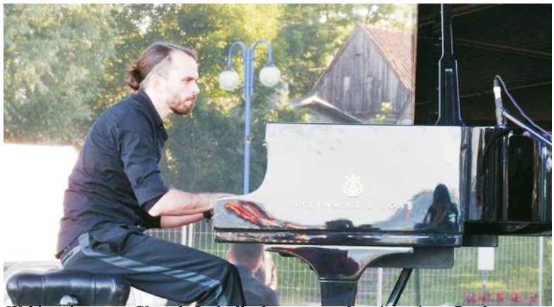
Wybitny jazzman Sławek Jaskulka koncertował w sierpniu w Pucku