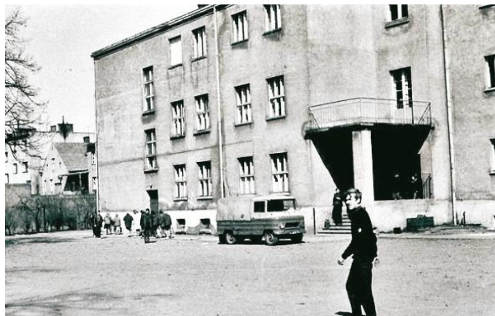
Liceum Ogólnokształcące przy ul. MDL-otu w dawnym wydaniu