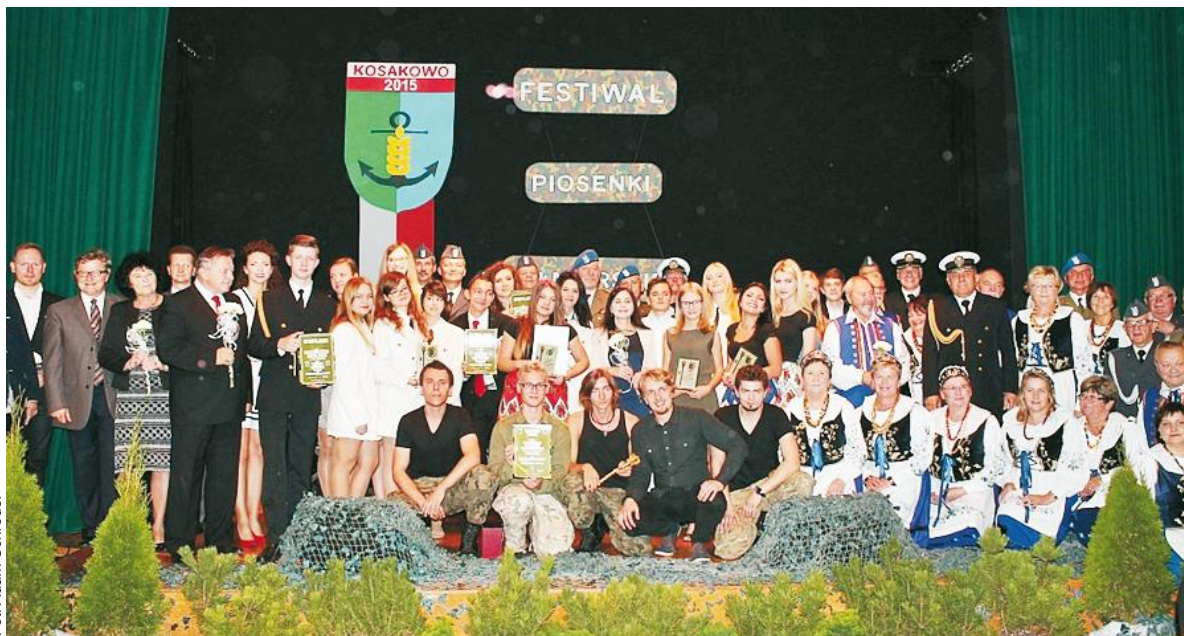
Festiwal Piosenki Żołnierskiej został powołany w celu uczczenia pamięci ofiar Obrony Kępy Oksywskiej oraz kultywowania wartości patriotycznych. Na zdjęciu uczestnicy i organizatorzy tegorocznego wydarzenia.