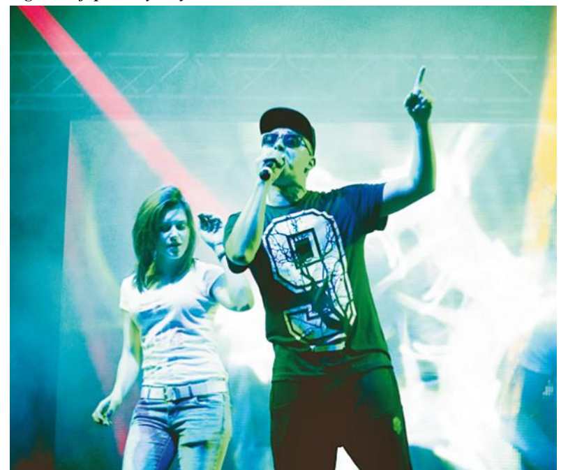
Zespół GESEK to jedna z gwiazd wieczoru dożynkowego w Kłaninie