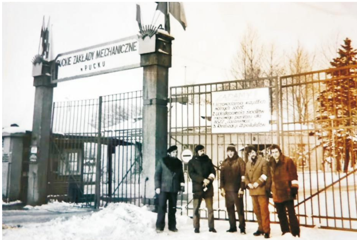
Pracownicy Puckich Zakładów Mechanicznych żywo uczestniczyli w strajkach walcząc o lepszy byt

20 października 1980 roku odbyło się zebranie założycielskie Komisji