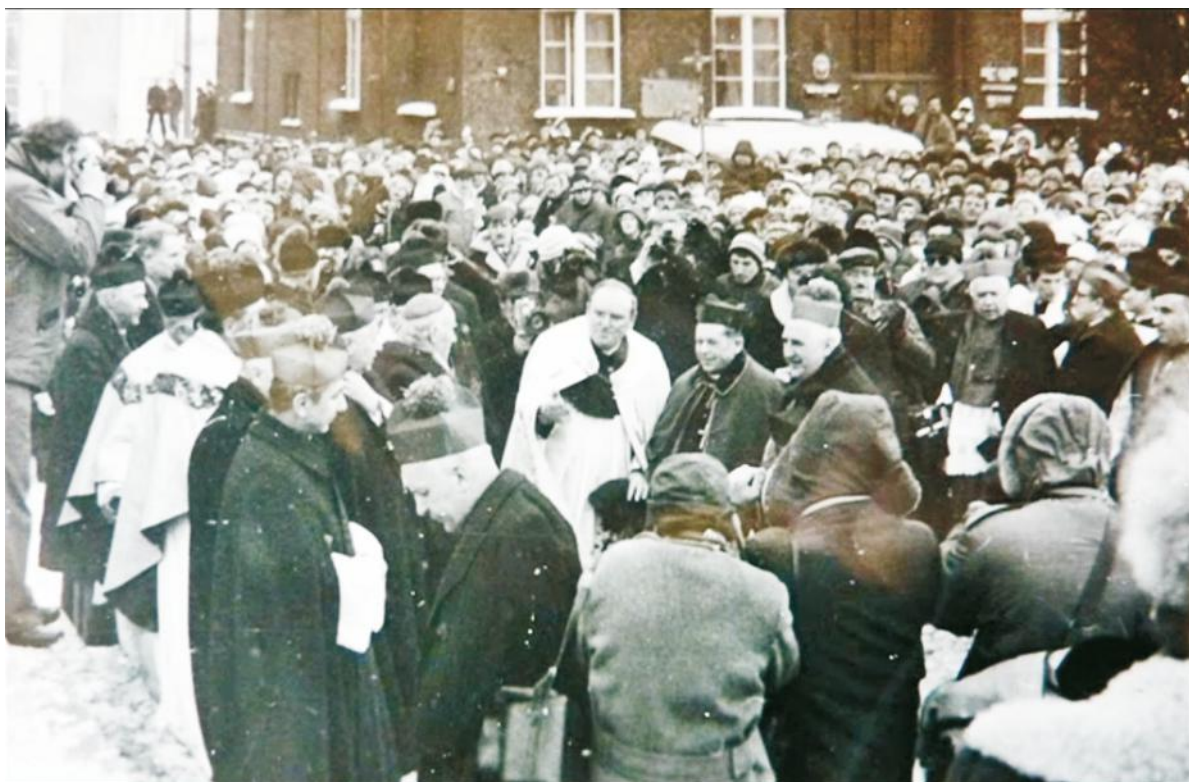
Wielka manifestacja patriotyczna w Pucku z okazji kolejnej rocznicy Zaślubin Polski z Morzem