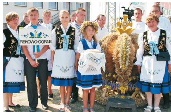
Starannie i z sercem przygotowane wiązanki zbóż i kwiatów cieszą niejedno oko

Tegoroczne dożynki Gminy Puck odbyły się w Domatowie. W imprezie uczestniczyły 23 sołectwa. Po oficjalnych obchodach - mszy św. i przemówieniach, został rozegrany turniej w trzech konkurencjach.