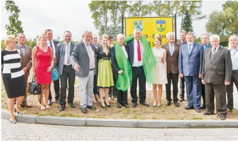
Odsłonięto pamiątkową tablicę przypominającą okrągłą rocznicę współpracy