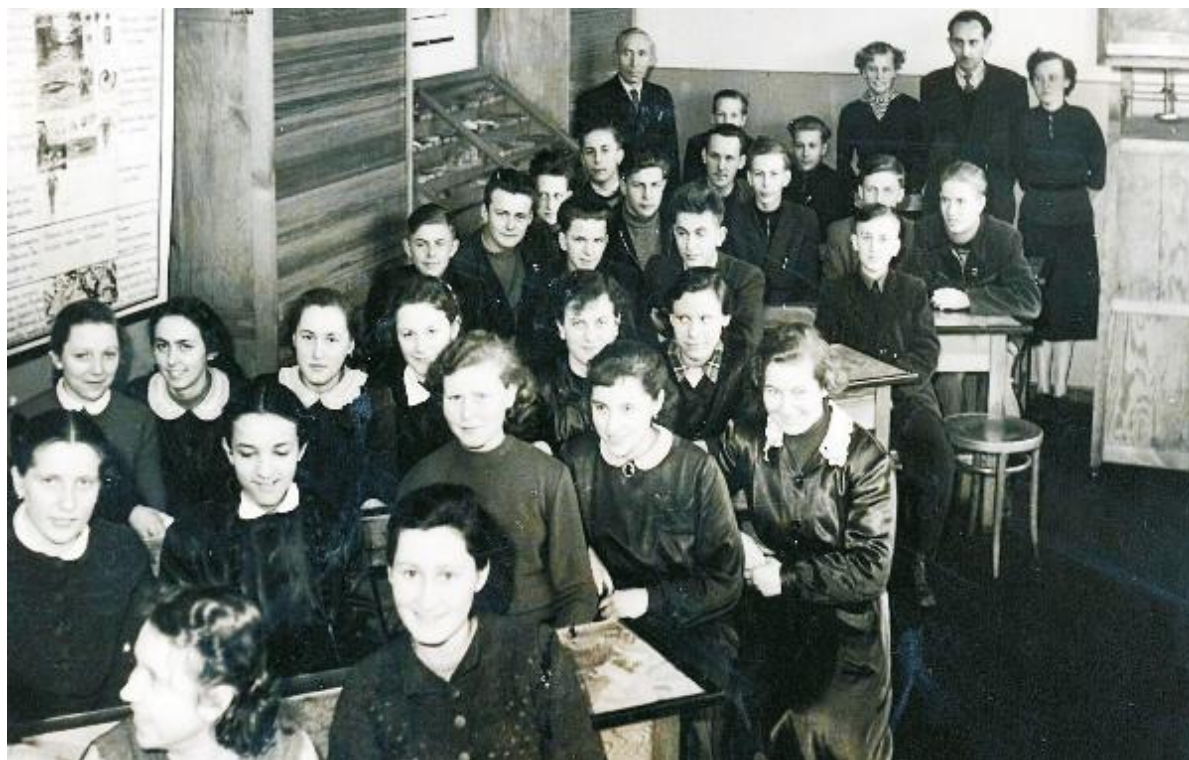
Pierwsze lata funkcjonowania szkoły po roku 1945 - klasy liczyły po ponad 40. uczniów

Funkcję dyrektora objąłem 1 września 1972 roku. Był to ostatni rok nauki w starym budynku szkolnym przy ulicy Świerczewskiego. W 1973 roku rozpoczęliśmy przeprowadzkę do nowych pomieszczeń przy ulicy Przebendowskiego. Tak więc inau-