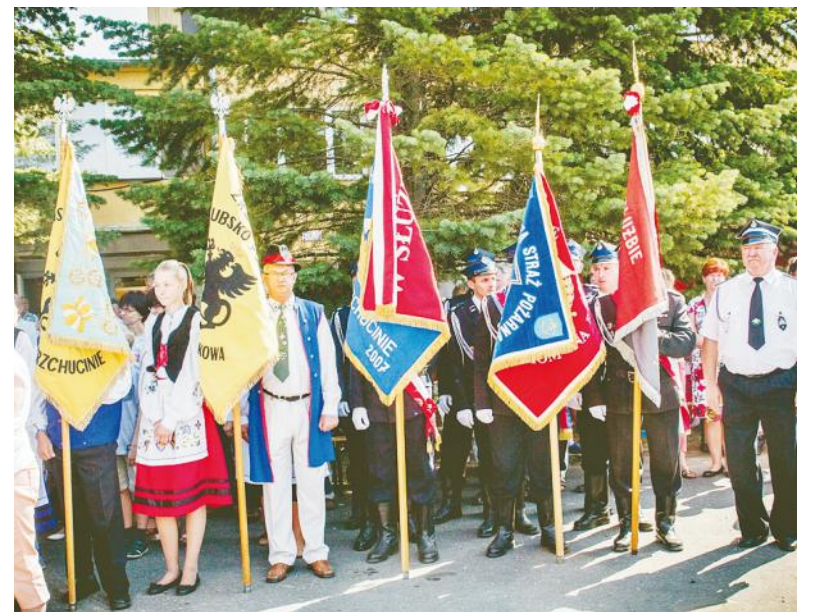
Podczas oficjalnych uroczystości były obecne delegacje straży pożarnej i organizacji pozarządowych ze sztandarami