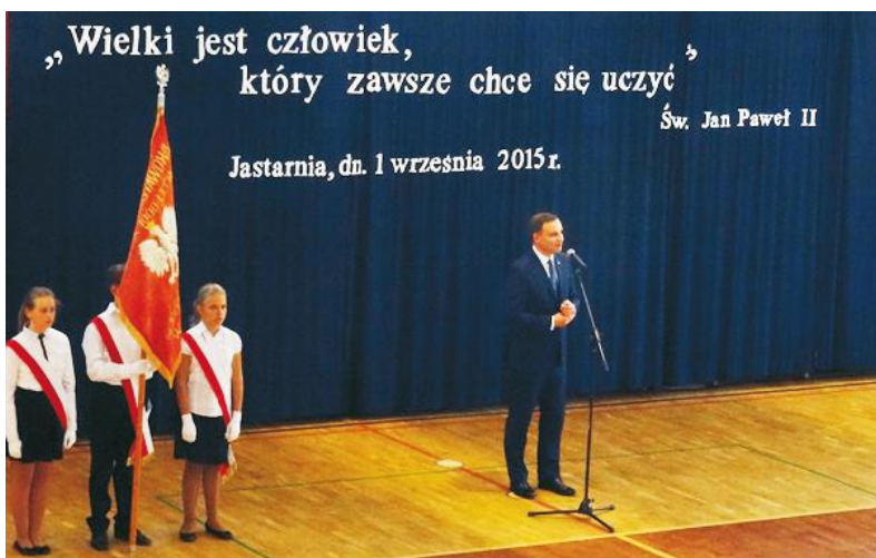
Prezydent podczas przemówienia skierowanego do dzieci, rodziców i nauczycieli