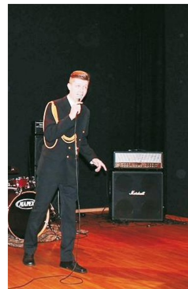
Strój tematycznie dobrze komponuje się z wykonywaną piosenką żołnierską w Pierwoszynie