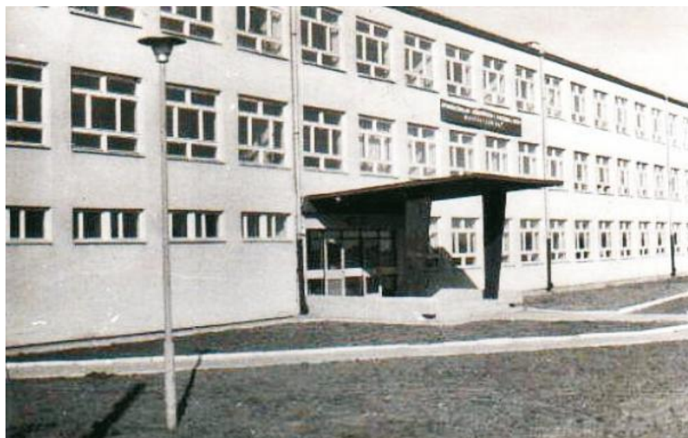
Budynek szkoły licealnej stacjonował początkowo przy obecnej ul. Przebendowskiego w Pucku