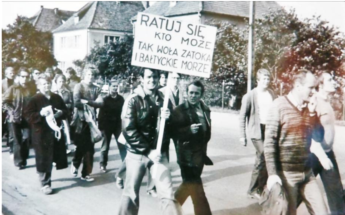
"Ratuj się kto może tak woła zatoka i bałtyckie morze" to jeden ze sloganów pojawiających się podczas demonstracji ulicznych

początku stanu wojennego, ale jest to efekt prac ludzi „S” w okresie zwanym karnawalem Solidarności).