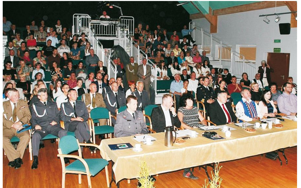
Jury konkursu oraz publiczność uważnie przysłuchiwali się każdemu występowi muzycznemu

Festiwal Piosenki Żołnierskiej został powołany w celu uczczenia pamięci ofiar Obrony Kępy Oksywskiej oraz kultywowania wartości patriotycznych.