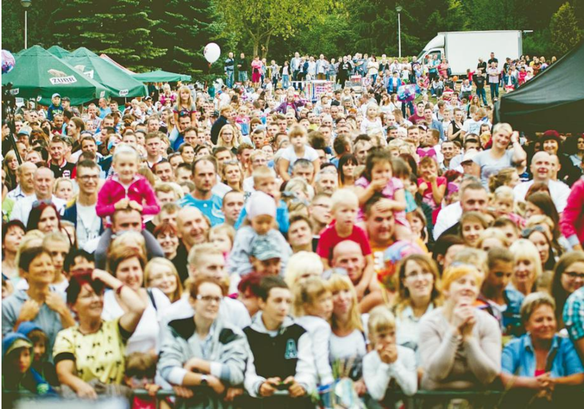
Program tegorocznych dożynek przyciągnął rekordową liczbę uczestników

W Kłaninie odbyły się wspólne Dożynki Powiatu Puckiego i Gminy Krokowa. To pierwszy taki przypadek w naszej historii.