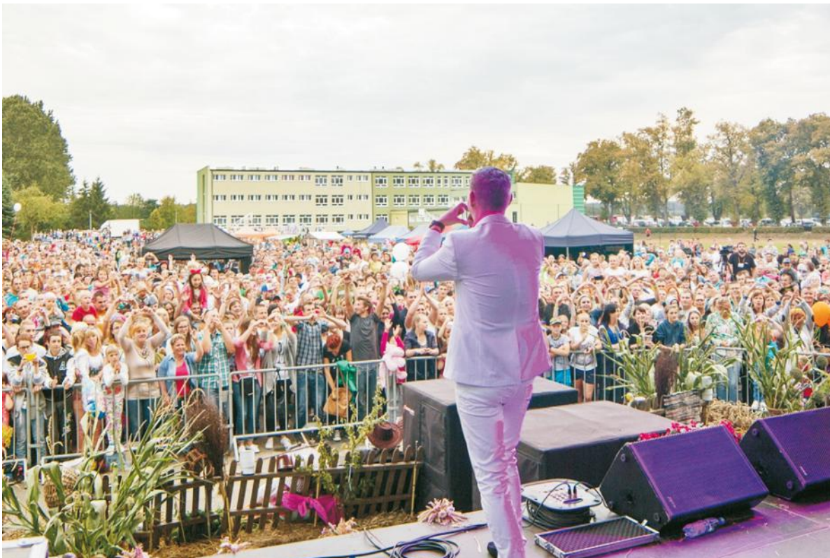
W mig oczarowali publiczność skoczną muzyką discopolową - na scenie zespół MIG