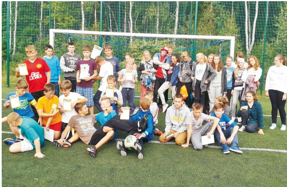
Mieszane drużyny piłkarskie zmagaly się na Turnieju Orlika o Puchar Premiera RP