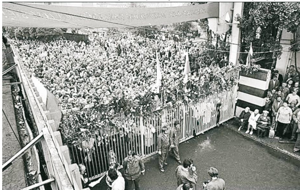
Brama stoczni w Gdańsku zamknięta, a tłumy ludzi strajkują i postulują o natychmiastowe zmiany systemowe

Ciekawym faktem był rekordowy udział w latach 1983 i 1984 młodzieży w pielgrzymkach maszerujących ze Swarzewa na Jasną Górę (trzon Kaszubskiej Pielgrzymki