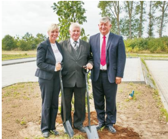
Wkopianie pamiątkowego dębu podczas jubileuszu