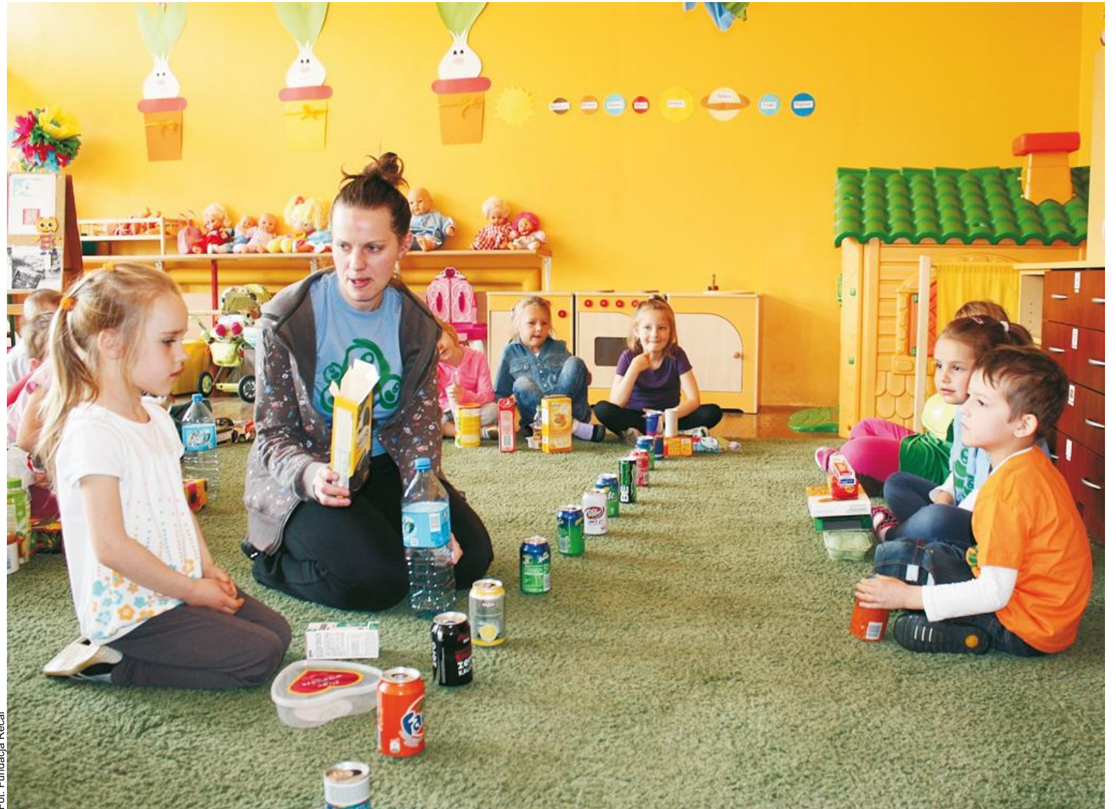
Puszki po napojach przydają się do celów dydaktycznych. W jaki sposób można ponownie zastosować opakowania? Edukator wyjaśnia

* Pieniądze: za kilogram puszek (67 puszek 0,331 lub 53 puszki 0,51) każdy może uzyskać w skupie około 3-4 zł.