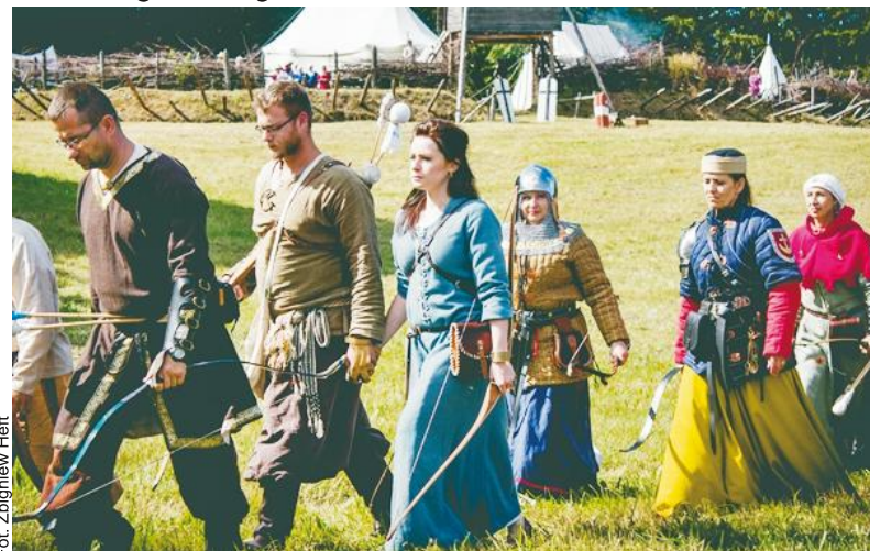
Wojownicy szykują się na bitwę. Mobilizacja sił to podstawa

Popołudniem sierpniowym przenieśliśmy się po raz kolejny w XV w. do Świecina, gdzie 17 września 1462 r. odbyła się jedna z ważniejszych bitew wojny trzynastoletniej. Dzięki Stowarzyszeniu Bractwo Ry-