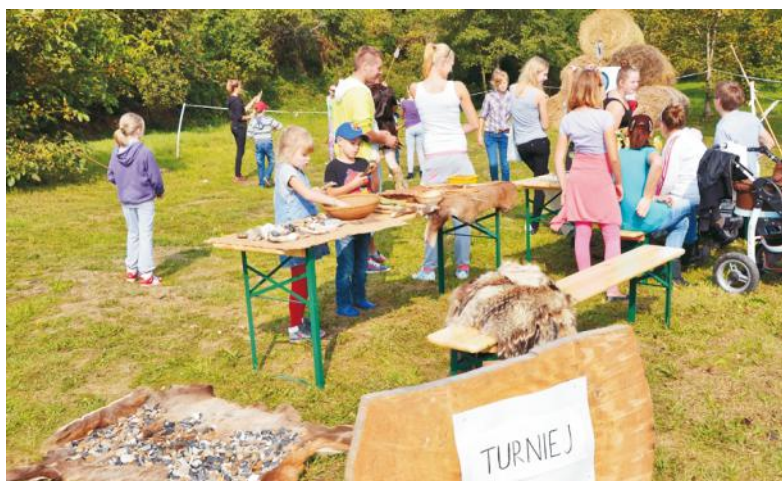
Warsztaty artystyczne i turnieje - tego możemy spodziewać się w Rzucewie