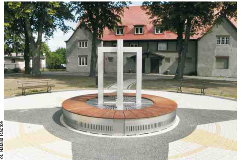
Imponująca „Rybaczką” w Dębkach