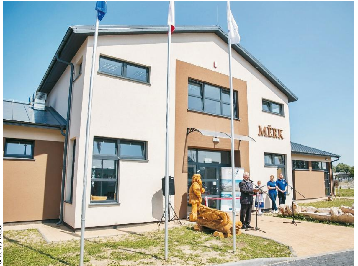
Budynek Centrum Promocji i Edukacji Szlaku Rybackiego Północnych Kaszub „MERK” we Władysławowie