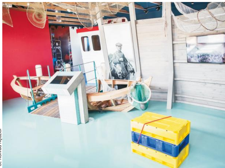
Multimedialna wystawa „Praca Rybaka: jak, gdzie, czym”