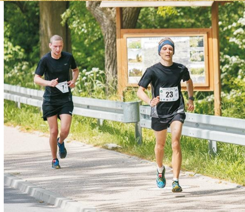
Miejscowi biegacze na ostatnich kilometrach trasy