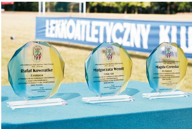
Trofea najlepszych zawodników LKS Ziemi Puckiej