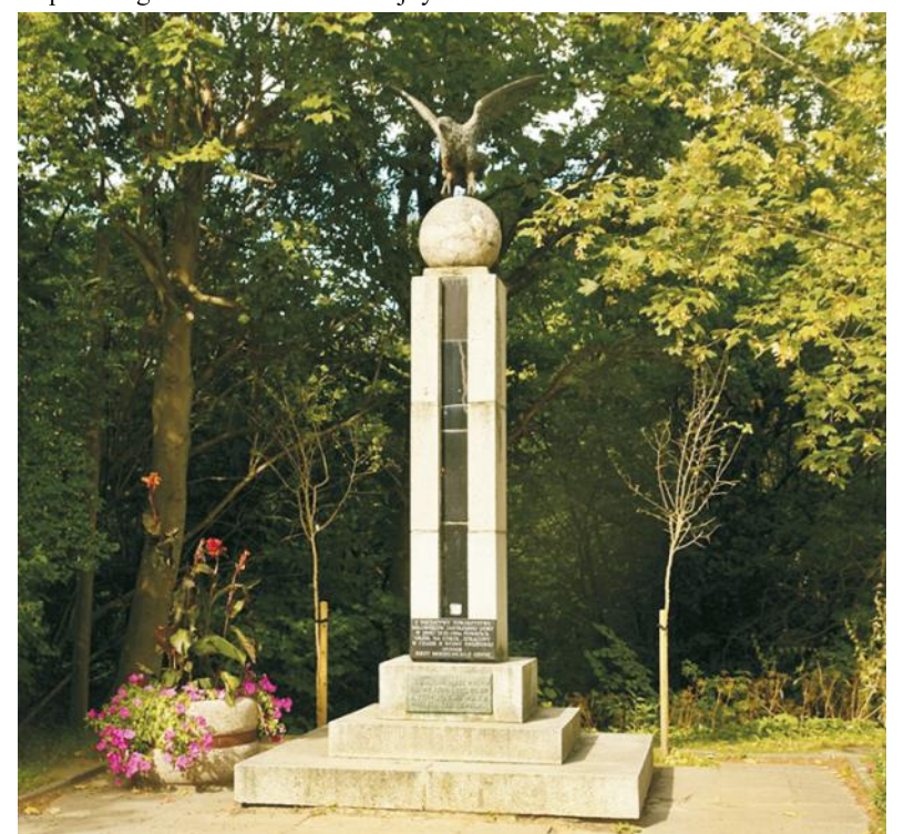
Jastrzębia Góra: pomnik przypominający o miejscu lądowania Zygmunta III Wazy