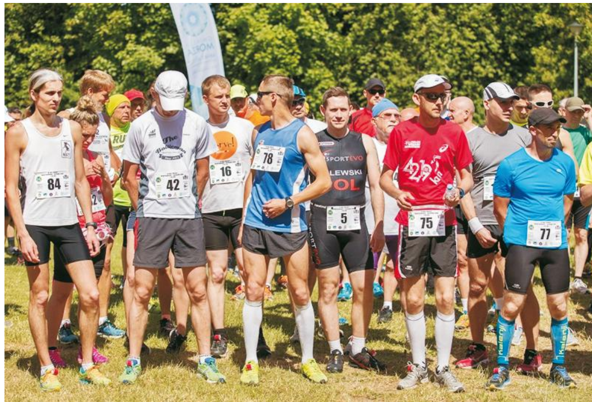
Uczestnicy Biegu Północy na starcie

Na trasie Władysławowo - Jastrzębia Góra odbył się III Bieg Północy. W zawodach wzięło udział 108 zawodników.