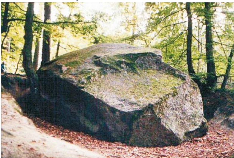
Diabelski Kamień - podobno miał zniszczyć żarnowiecki klasztor