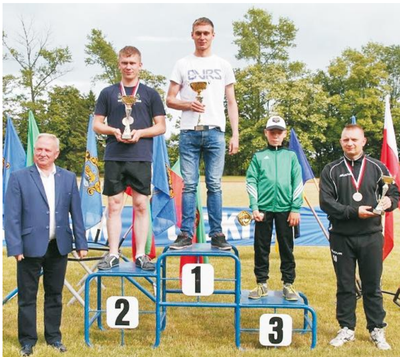
Zwycięzcy jednej z konkurencji lekkoatletycznych mistrzostw rozegranych w Pucku

Mistrzostwa lekkoatletyczne gminy Puck i LKS Ziemi Puckiej zostały rozegrane 21 czerwca na stadionie w Pucku. Impreza została przeprowadzona w klasyfikacji indywidualnej oraz zespołowej.