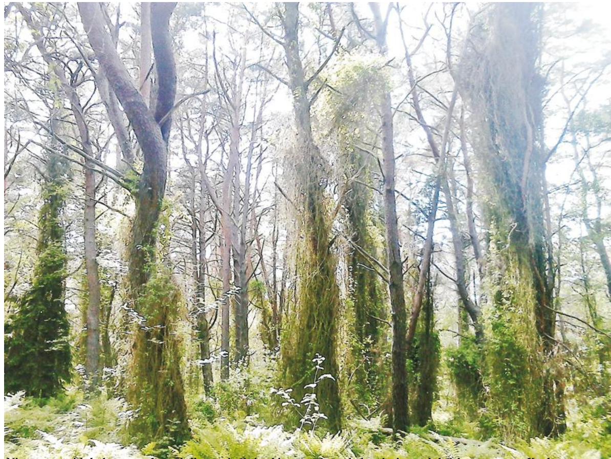
Nietypowy widok drzew otulonych lianami. Coś takiego można obejrzeć nieopodal Odargowa gm. Krokowa

W naszej krainie są niesamowite miejsca, które przypominają inny świat, inną rzeczywistość. I tak można szybko przenieść się na przykład w afrykańskie lub amazońskie lasy równikowe, słynące z występowania licznych gatunków lian.