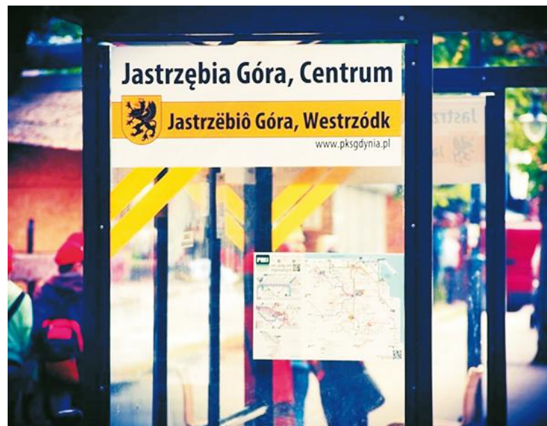
Jeden z przystanków w Jastrzębiej Górze, gdzie również pojawiło się nowe oznakowanie